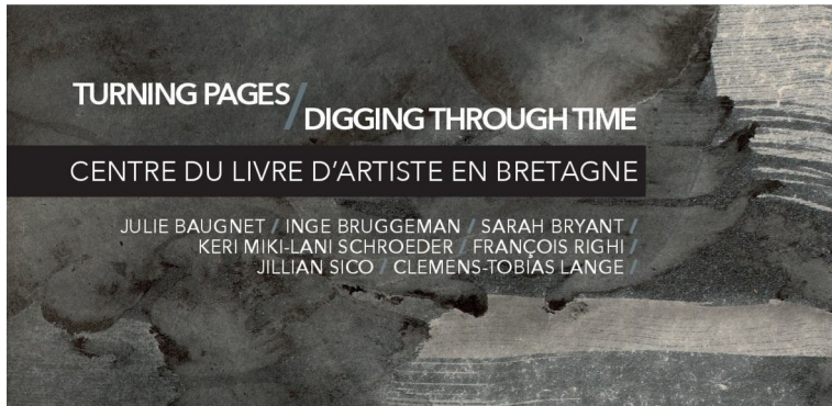
Détail du livre Kalumet de Clemens-Tobias Lange

Tél. 06.35.43.44.23 ou clab.plougonven@orange.fr